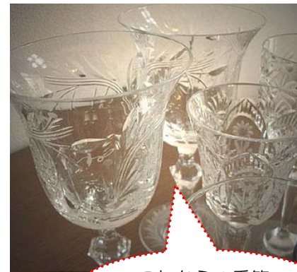
これからの季節 透き通ったグラスは 涼しげ

クリスタルガラスやカットガラスは食器洗い機に入れると白く曇ったり割れたりするので必ず手洗いにしましょう。